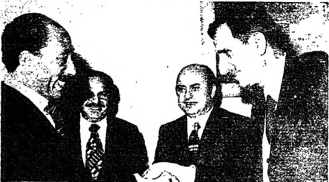
■ مع الرئيس السادات عام ٧٤ ■